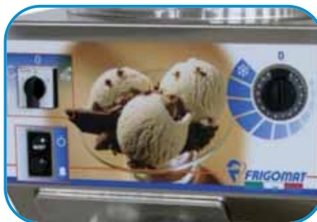
G20 - G30